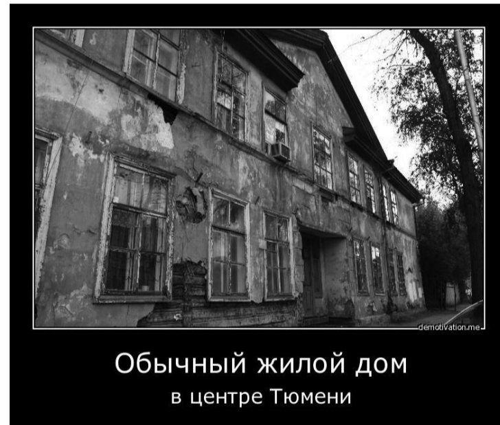
Обычный жилой дом в центре Тюмени

Общие тенденции таковы: многие крупные города Дальнего Востока, а также Сибири и центральной России (прежде всего, столицы областей) являются джапм-площадкой для