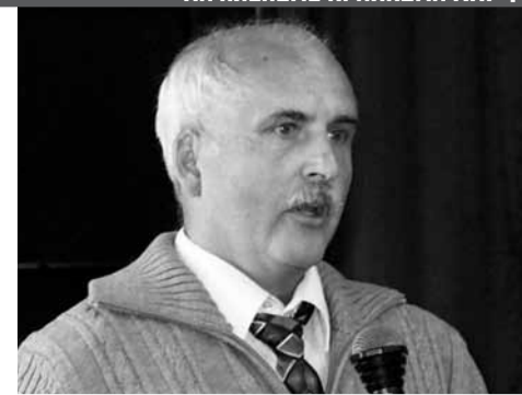
НА ПЛЕНУМЕ КРАЙКОМА КПРФ

цати лет демографическом кризисе в России, переросшем в национальную катастрофу, что негативным образом сказывается на вопросах устойчивого развития государства. В разделе о созданных при поддержке КПРФ организациях и движениях назвать Союз Советских офицеров.