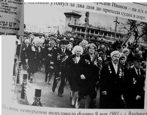
Пл. тинас встеранов торгового флота 9 мая 1993 г. в Владивостоке

Ясно, что ныне торговые суда стали лишь предметом и способом получения прибыли для частных владельцев. Но неровен час... И книга «Морской торговый флот СССР во Второй мировой войне» каждому курсанту от министра могла бы