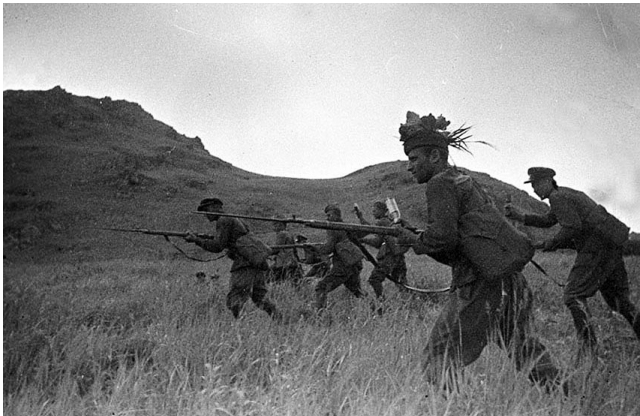
Красноармейцы идут в атаку на сопке Заозёрной...