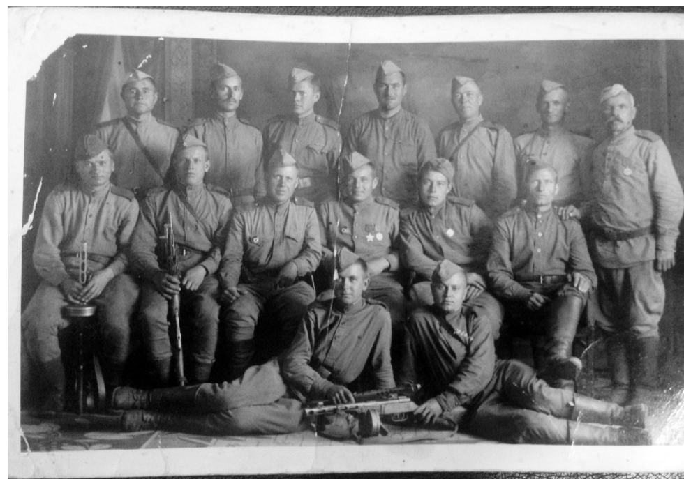
Мой отец стоит - третий справа.

Я часто вспоминаю своего немногословного отца. Окончив первый курс Ленинградского библиотечного института имени Н.К. Крупской