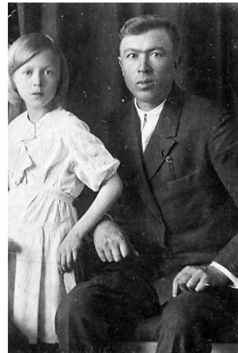
Я и папа.