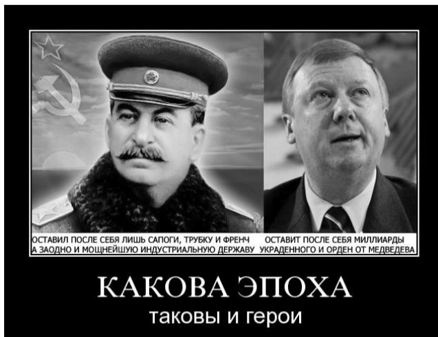
КАКОВА ЭПОХА таковы и герои

Так было и в тот вечер, который мне запомнился. Придя на ферму, доярки в первую очередь стали разносить силос по кормушкам для коров. Через некоторое время подзывает меня мать и говорит, что сейчас все люди пойдут в «Красный уголок», так как из города приехал какой-то дядя и что-то важное нам собирается сказать, поэтому я не должен куда-нибудь убежать, а лучше, если я буду находиться