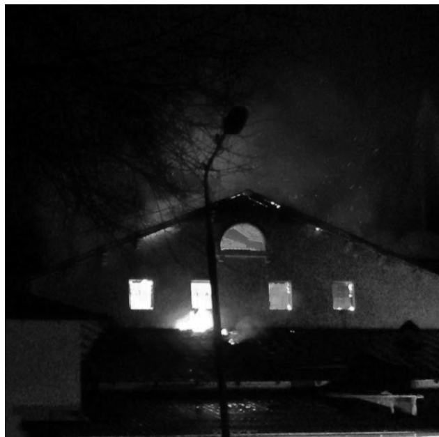
На снимке: в Дальнегорске горит Дворец культуры «Горняк»

Когда я бываю в Дальнегорске, даже, не смотря на разруху парка, люблю посещать его. Хочется полюбоваться на талантливо исполненный, величественный памятник гению, Слава богу, нашлась благородная душа, ко-