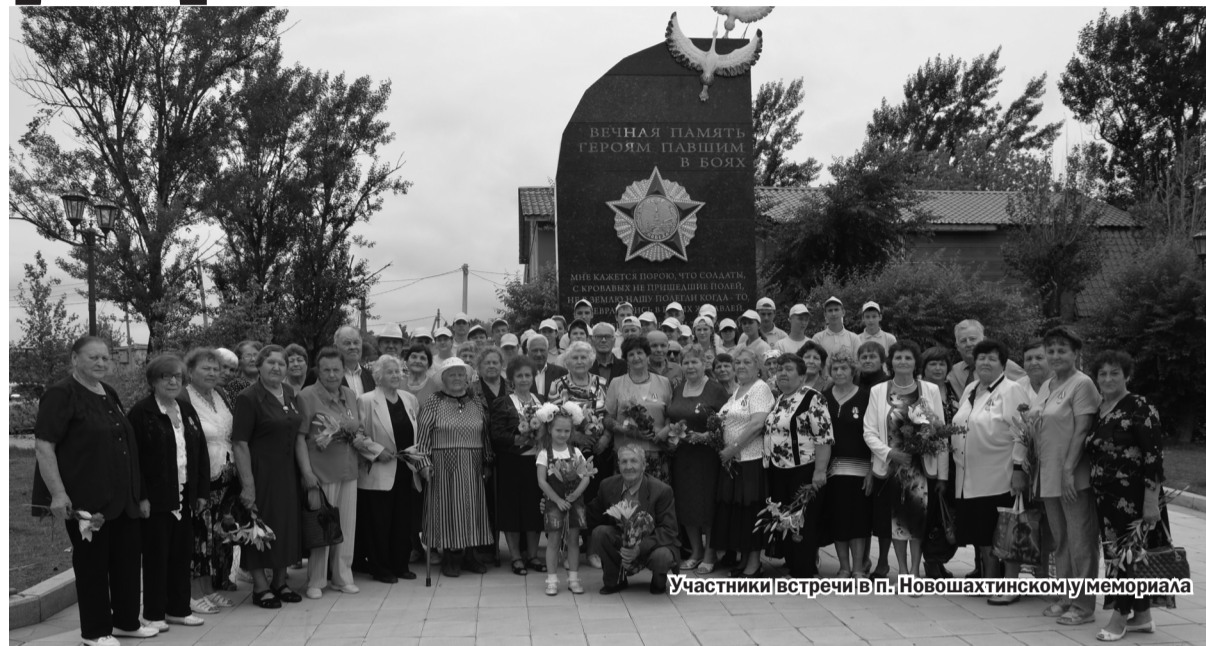
Участники встречи в п. Новошахтинском у мемориала

лать и свой опыт другим передают. Но они не вечны! Придет время и уже некому будет рассказывать о личных переживаниях, и о том, каких трудов им стоило в подростковом возрасте работать наравне со взрослыми, а не учиться, не отдыхать под родительским крылом. Со всех был одинаков спрос. Свои трудовые книжки они получали раньше, чем паспорта. Их выдавала война. И мы все должны помнить об этом и о том, что в войне, укреплению экономики и финансах, гибнут и дети.