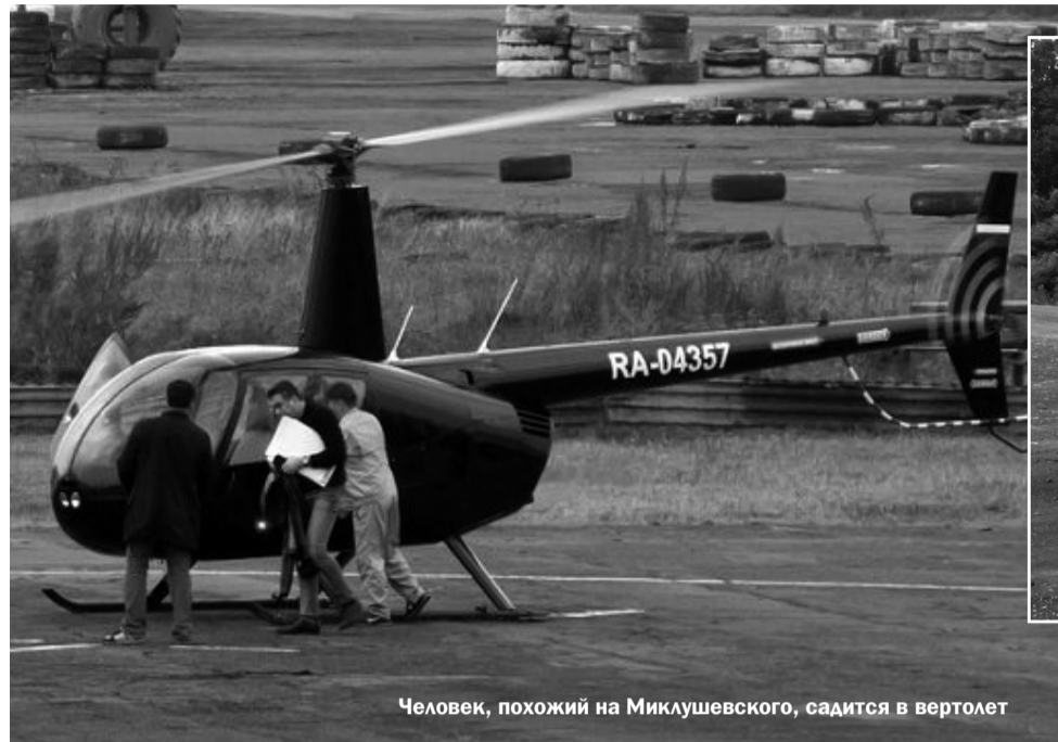
Человек, похожий на Миклушевского, садится в вертолёт