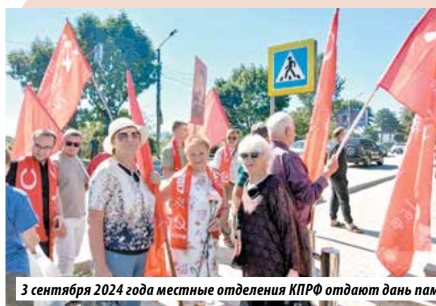
3 сентября 2024 года местные отделения КПРФ отдадут дань памяти победителям японского милитаризма