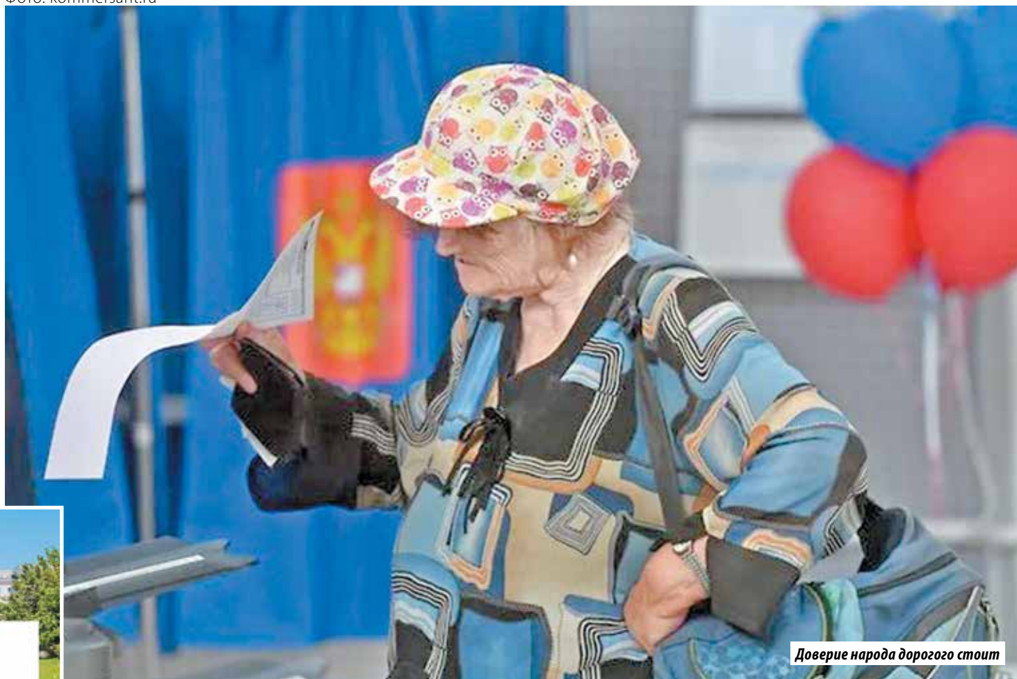
Доверие народа дорогого стоит