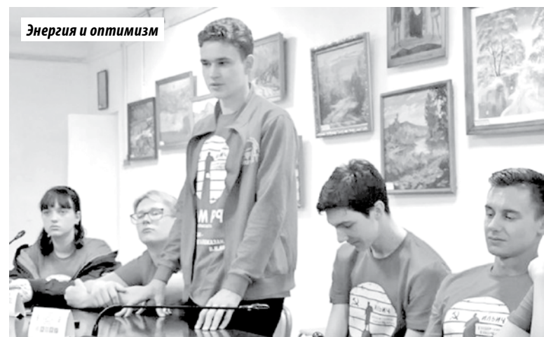
Энергия и оптимизм