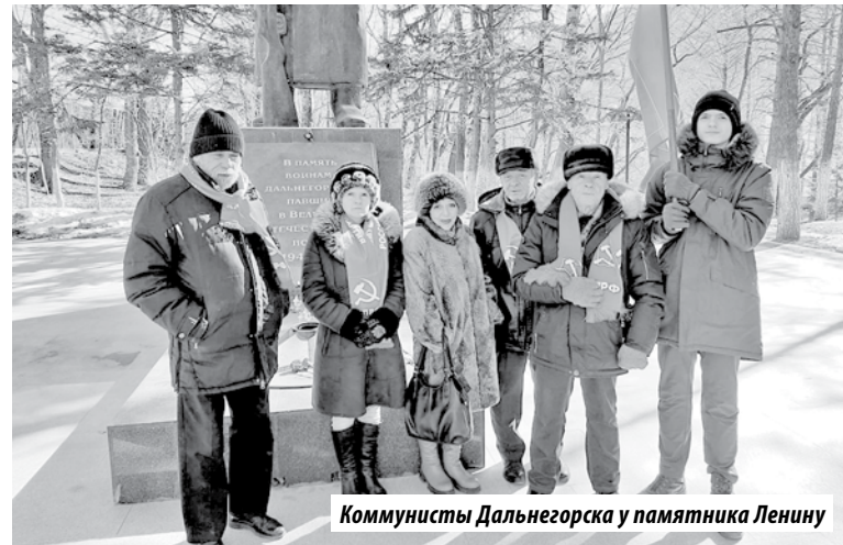
Коммунисты Дальнегорска у памятника Ленину

– В настоящее время «Дальполиметалл» находится в труд-