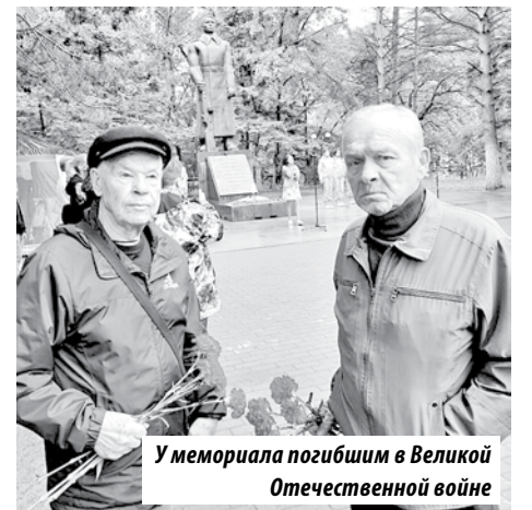
У мемориала поишим в Великой Отечественной войне