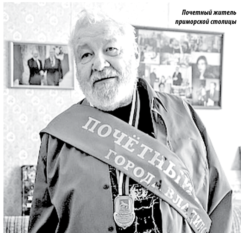
Почетный житель приморской столицы

Такие действия вызвали недовольство активной общественности, что привело под давлением активистов и комму-