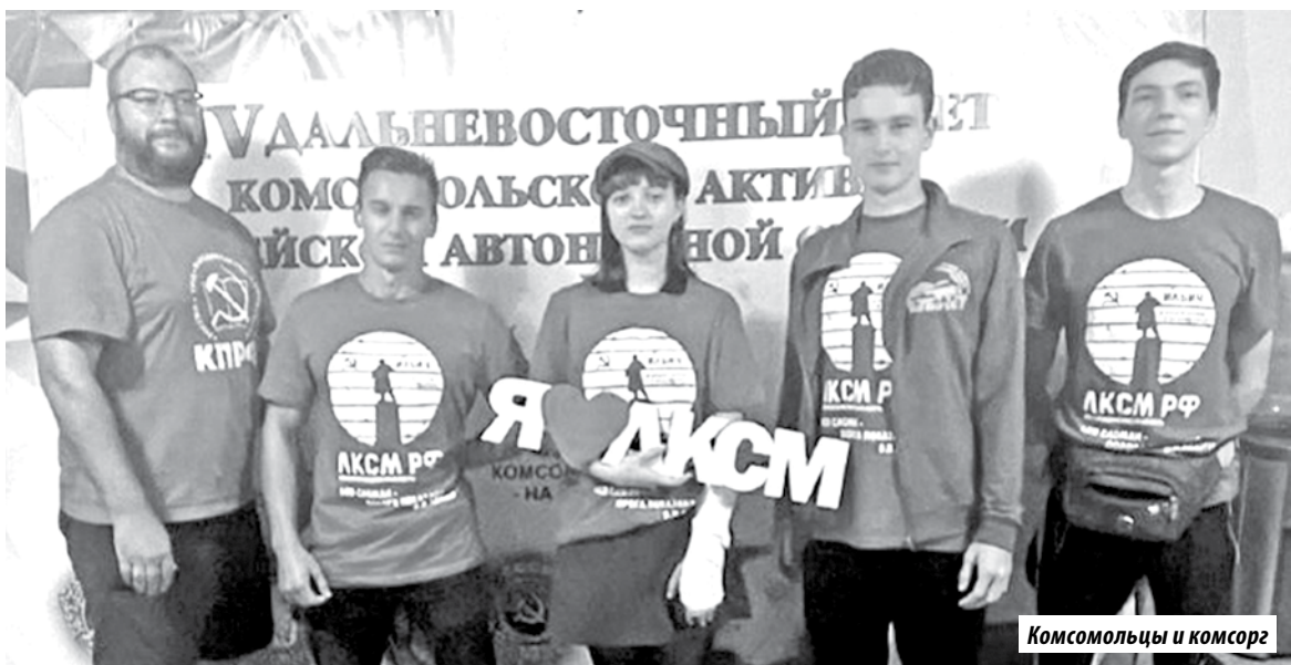
Комсомольцы и комсорг