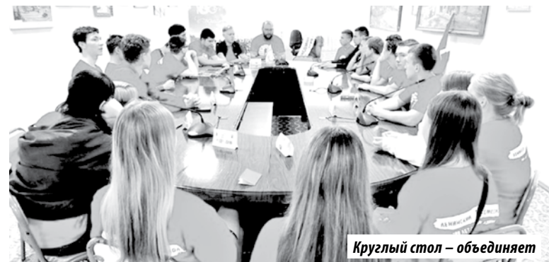
Круглый стол – объединяет

На протяжении всего мероприятия комсомольцы активно делились мнениями, спорили и приходили к различным умозаключениям. По окончании круглого стола была проведена экскурсия в музей санатория «Кульдур». Во время экскурсии комсомольцы узнали об истории строительства и развития санатория, о партизанских отрядах, боровшихся за установление Советской власти на Дальнем Востоке.