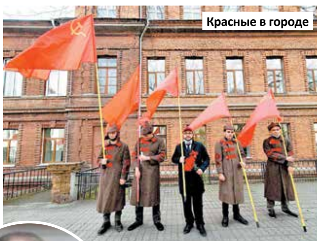
Красные в городе