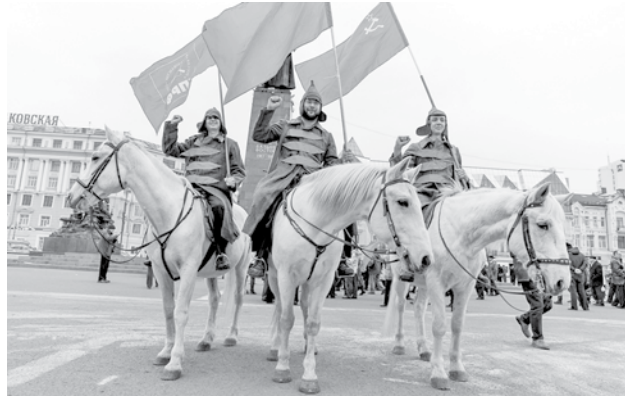
100-летие революции, 2017 год.

7 ноября 2023 года исполняется 106 лет Великой Октябрьской социалистической революции. Праздник знаком и близок любому человеку, рожденному и воспитанному в СССР.