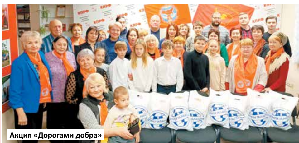
Акция «Дорогами добра»

29 ОКТЯБРЯ 2023 ГОДА ОТМЕЧАЕТСЯ 105 ЛЕТ ВЛКСМ