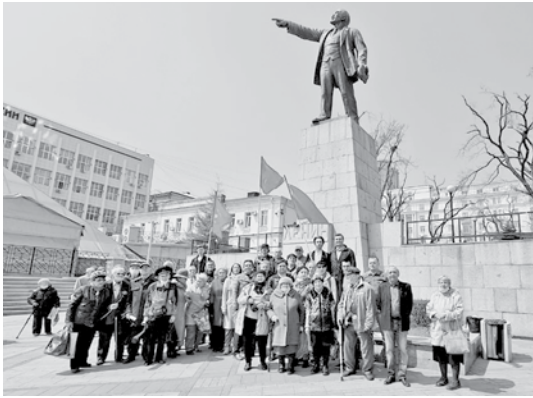
К памятнику Ленина 7 ноября не подходить?