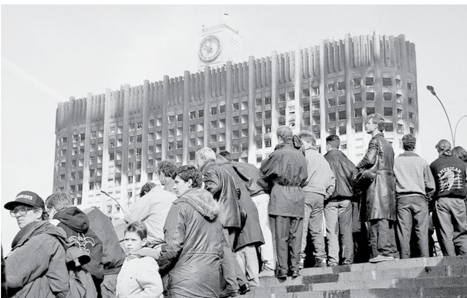
По материалам kprf.ru, aif.ru, «Коммерсант», из статьи журналиста Галины Платовой – https://dzen.ru/a/Yz_4sgGaXSEeMprl .

Член Президиума ЦК КПРФ, Депутат Государственной Думы Николай Харитонов.