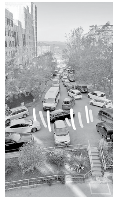
В потоке машин – куда деваться пешеходу?

«Проехать трудно, но пройти совсем нереально: как мы должны добираться через мост, если пешеходная дорожка с левой стороны закрыта на ремонт, а справа подходы перерезаны? Ребёнок вынужден лезть через забор за Казанской, чтобы подобраться к мосту и попасть после