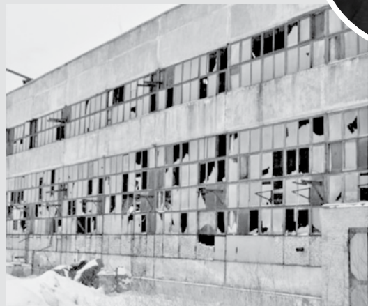
«Эффективное хозяйствование» частных на примере Дальнегорского ГОКа выглядит так

В прокуратуре отметили, что Дальнегорский ГОК является стратегическим предприятием для обороны страны, именно поэтому приобретение его доли было незаконным. Суд полностью встал на сторону прокуратуры, отменив приватизацию предприятия.